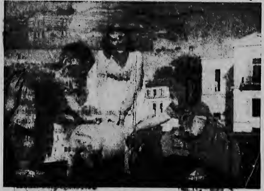
Cu frecuencia e princesnan ta hunga den e jardin grandi di palacio real na Soestdijk cu e animalnan, qu nan tin aya na gran cantidad.